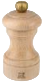
Moulin à sel naturel H. 10 cm 40058P