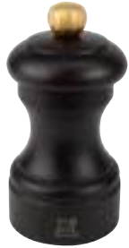
Moulin à poivre chocolat H. 10 cm 59594P